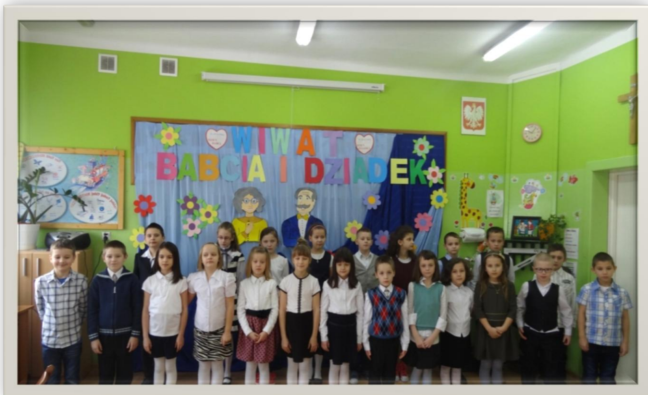
Uczniowie klasy II a

Serdecznie dziękujemy również naszym rodzicom za okazaną pomoc podczas tej uroczystości.