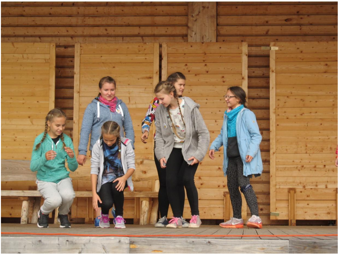
Prezentacja piosenki, okrzyku i hasła w formie kalambury