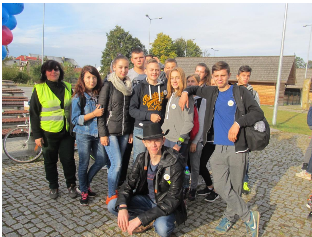
Klasa IIID gimnazjum – wych. J. Bałdyga