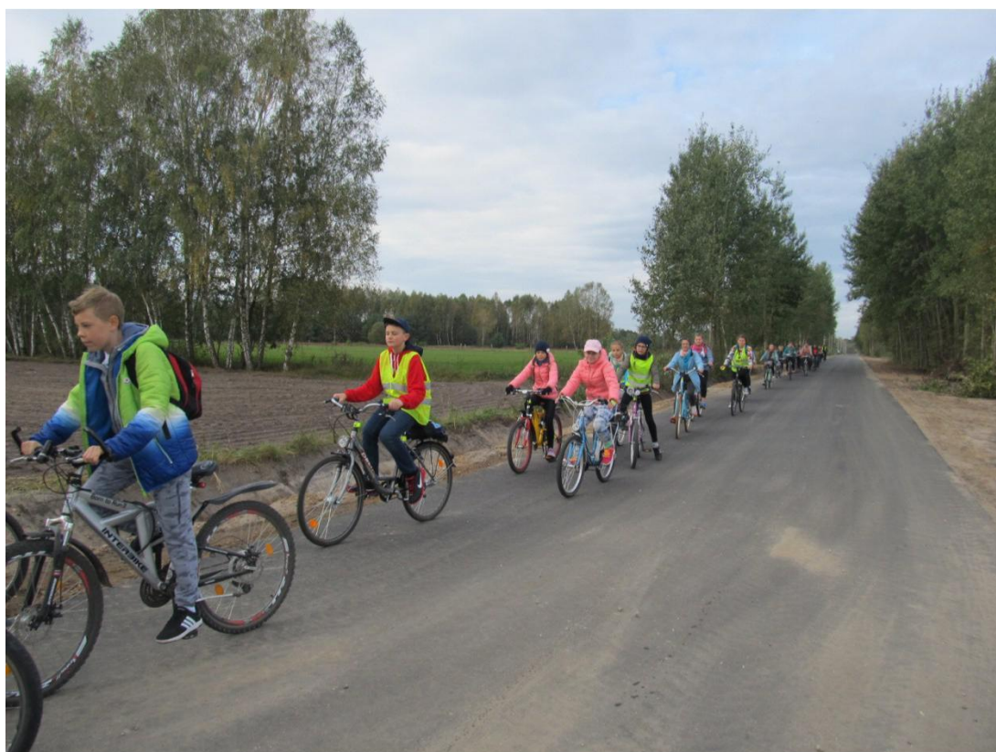
Uczniowie z klasy VI A na trasie.