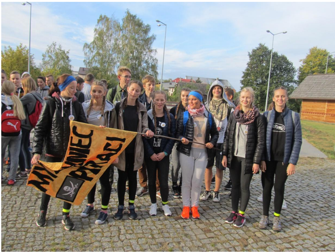
Klasa IIIC gimnazjum – wych. Z.Ścibek