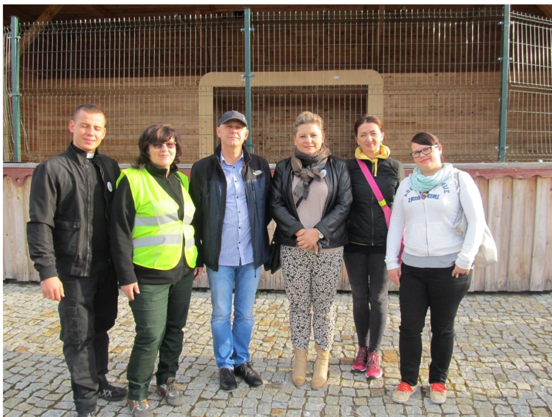
Opiekunowie grup i komenda rajdu