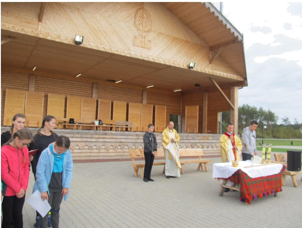
Udział wszystkich uczestników we mszy świętej