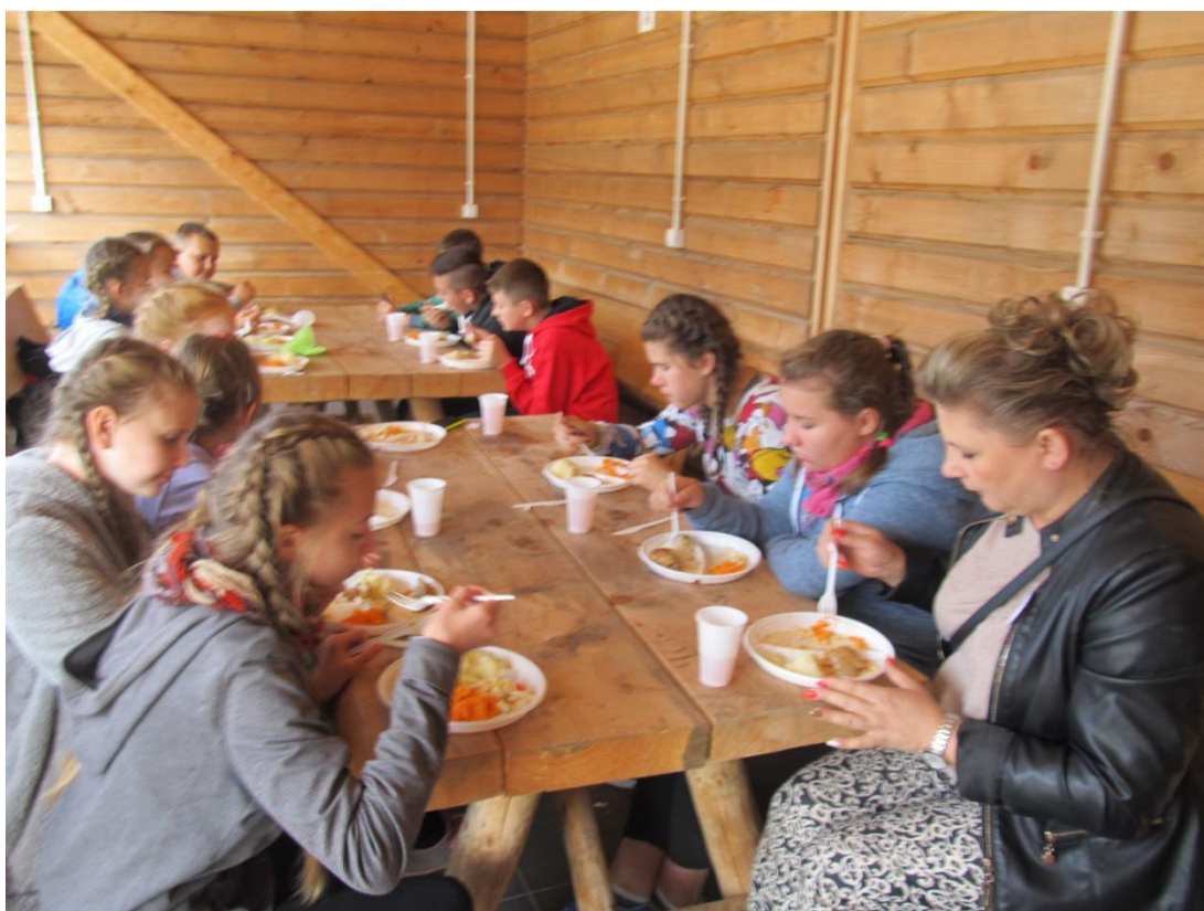
Obiad, który kończył całą imprezę.